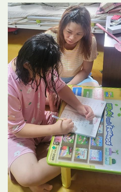
방문교육사업 - 부모교육