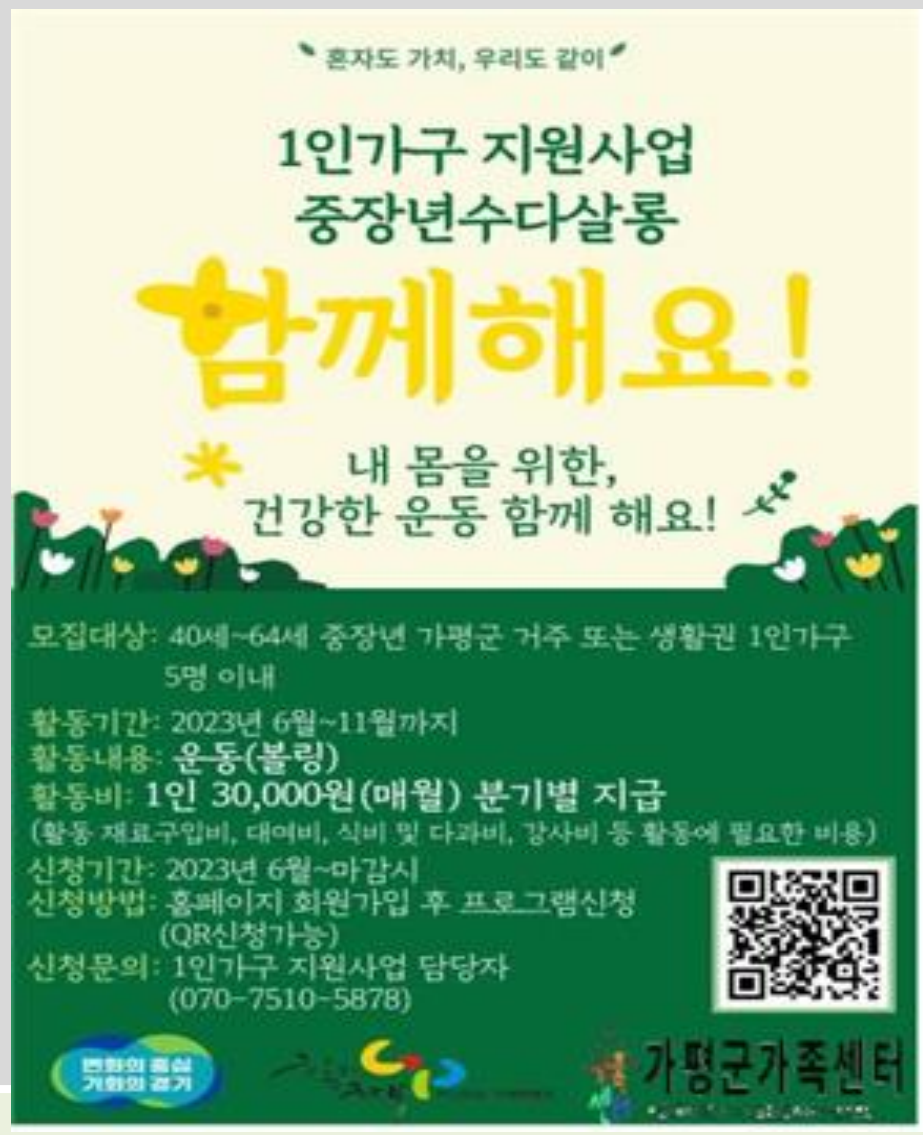
1인가구지원사업 중장년 수다살롱[볼링]