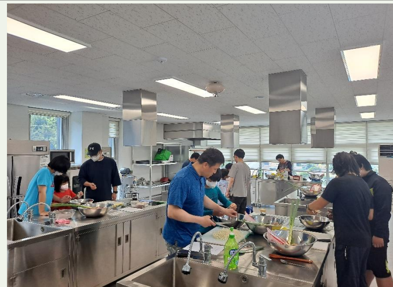
가라바라 레인보우 패밀리 "아빠, 자녀"