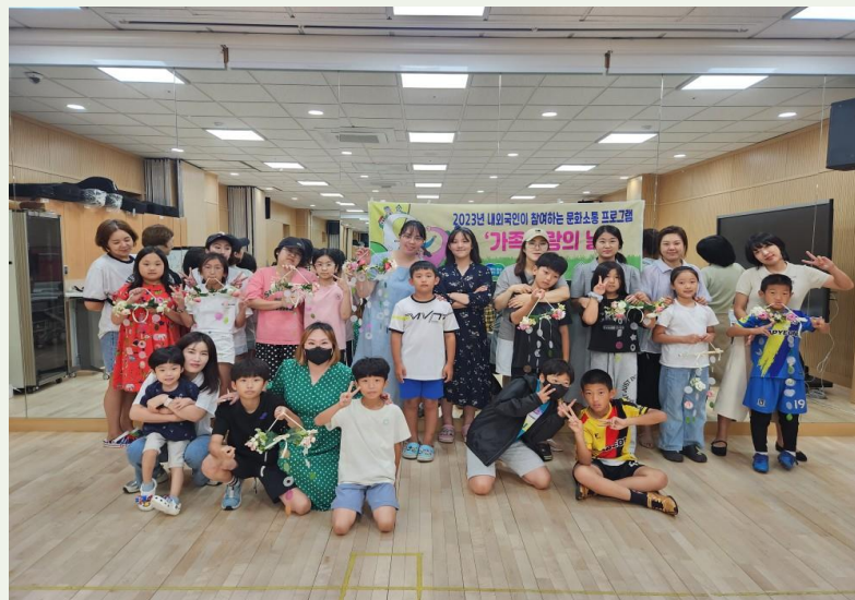
내외국인이 참여하는 문화소통프로그램 '가족사랑의 날'