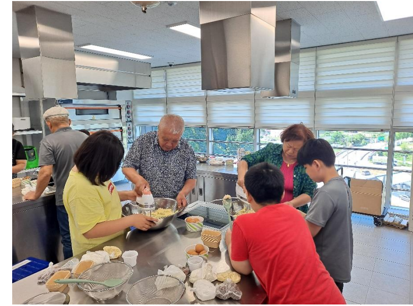
가라바라 레인보우 패밀리 "조부모, 손자녀"