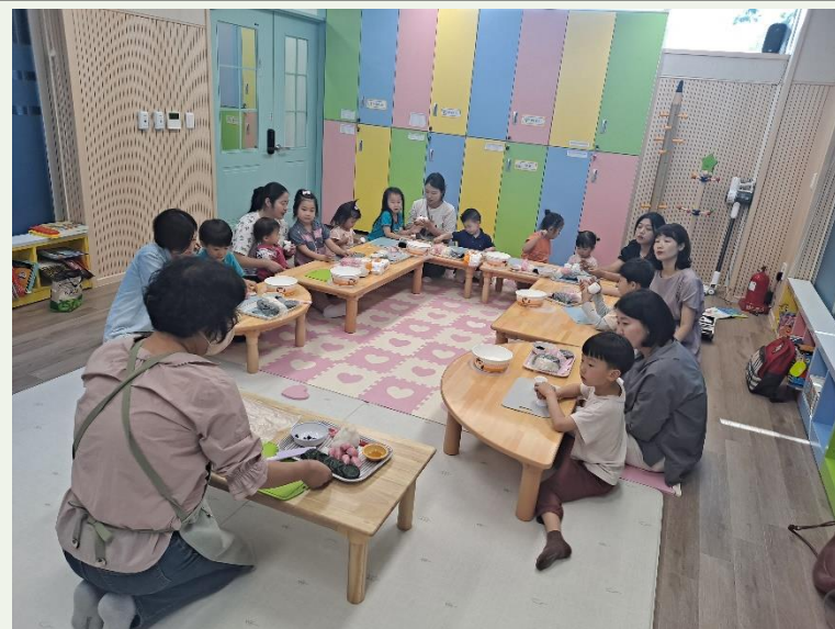
가라바라 돌봄터-오늘은 내가 요리사 [설악분소]