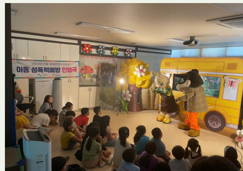
아동여성지역연대사업 '아동성폭력 인형극'