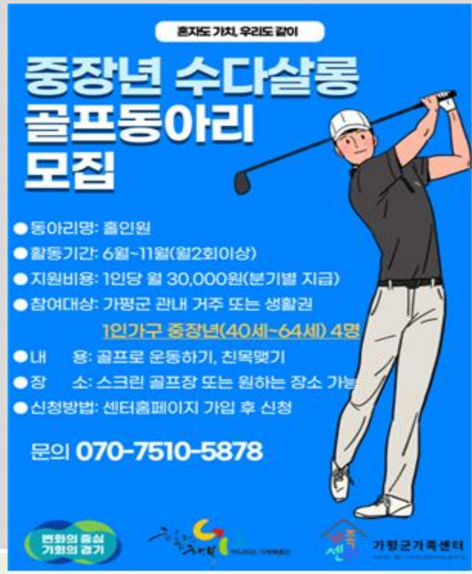
1인가구지원사업 중장년 수다살롱[골프]