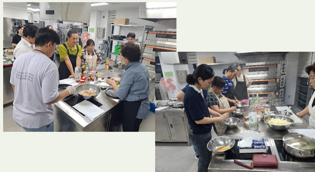
가라바라 레인보우 패밀리 "부부"