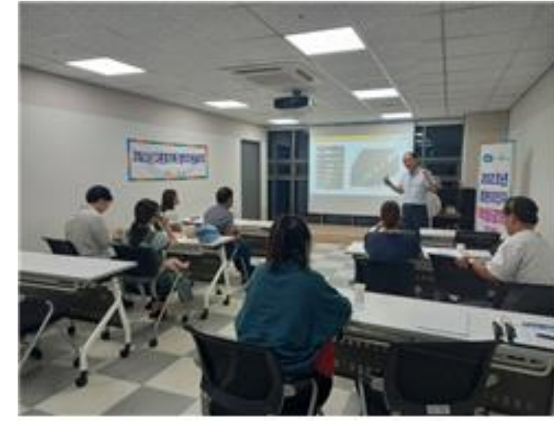
다문화가족 정착지원 패키지