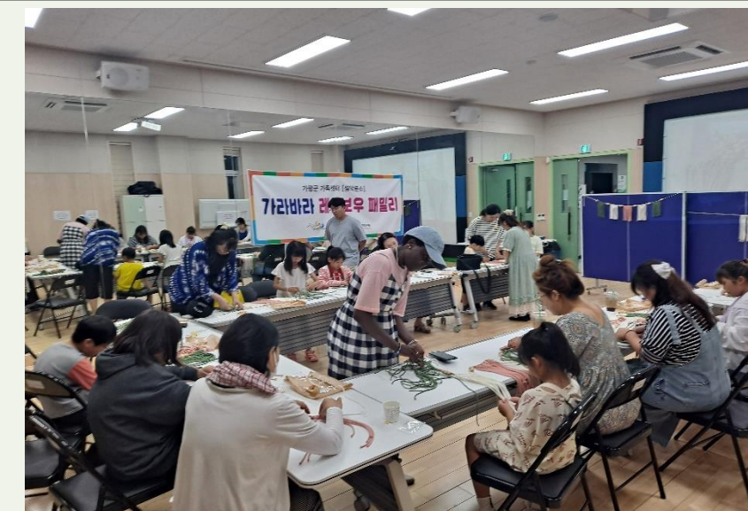
가라바라 레인보우 패밀리 "엄마, 자녀"