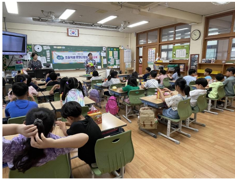
지역주민 인식개선을 위한 문화다양성 이해교육