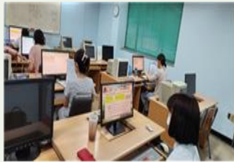
결혼이민자 취업교육 지원