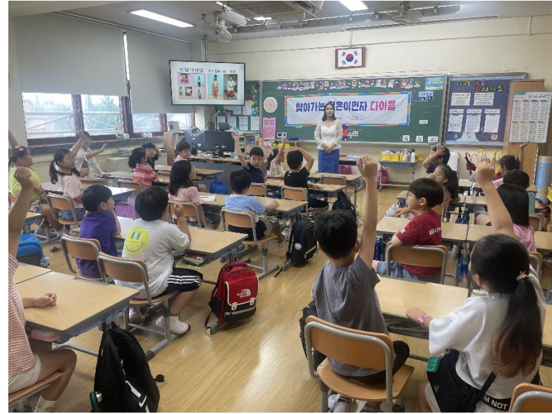
찾아가는 결혼이민자 다이얼 사업