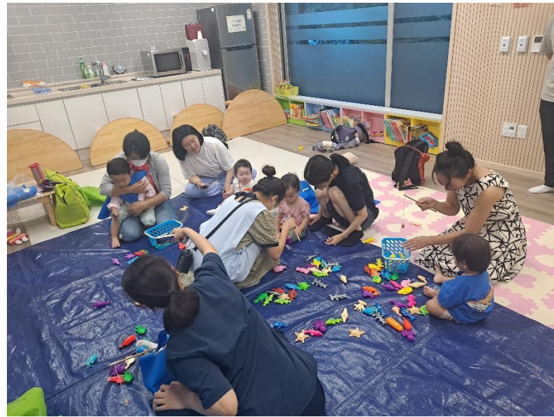
가라바라 돌봄터 '오감음률놀이'