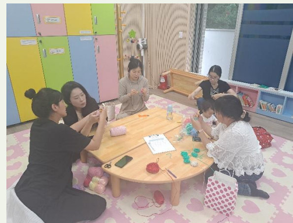
가라바라 돌봄터 '함께키움' 엄마 자조모임