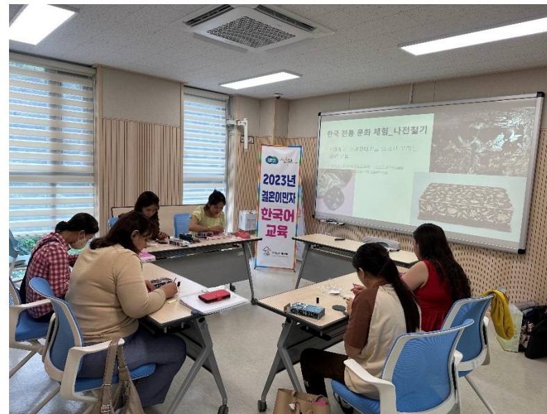
결혼이민자 한국어 교육-설악