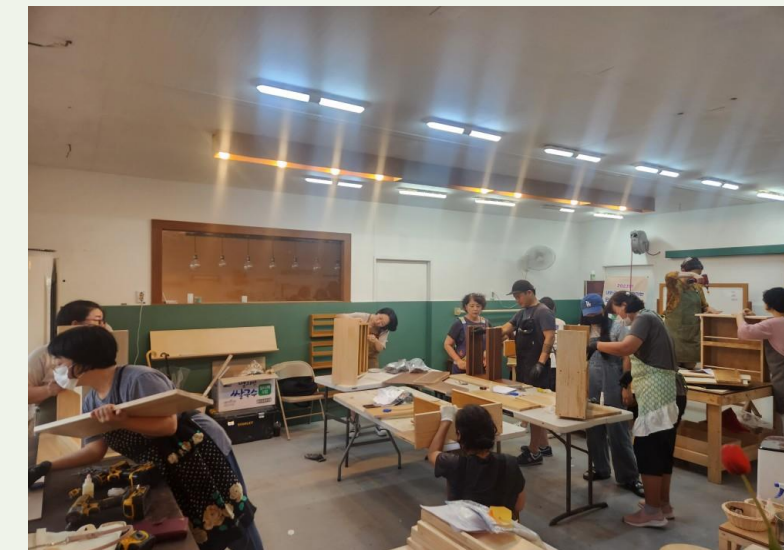
내외국인이 참여하는 문화소통프로그램 '목공자조모임'