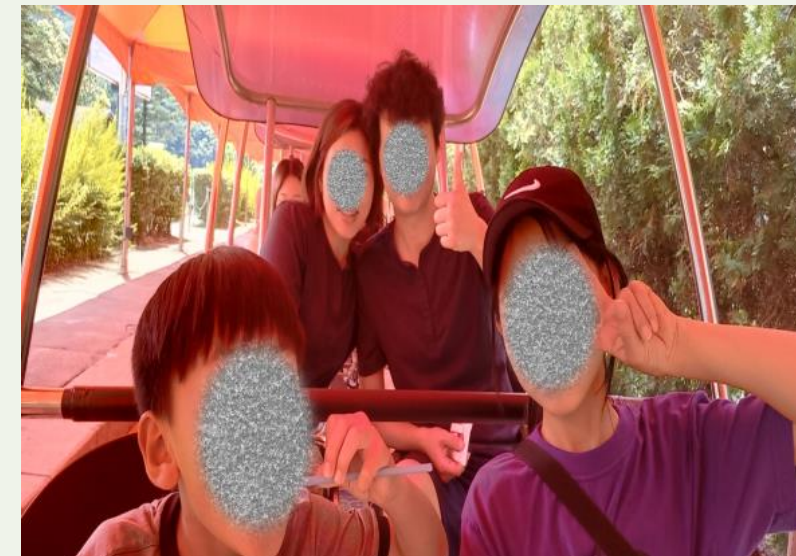
가족친화직장문화조성사업-우리가 행복한 일터