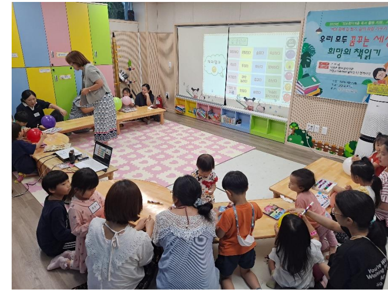
독서지원사업 '책과 함께 길 찾기'[설악분소]